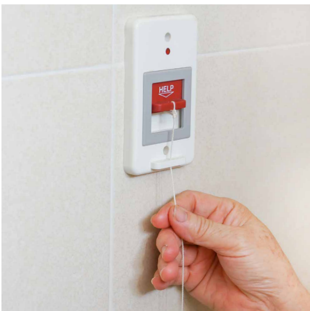
Voorbeeld van een alarmunit